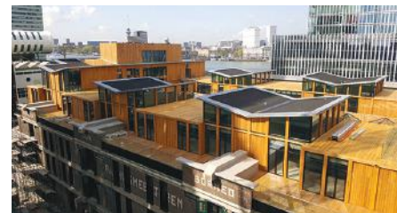
PAKHUIS MEESTEREN IN ROTTERDAM