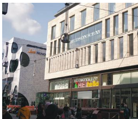
VOORMALIGE V&D DEN HAAG

Kentie en Partners dankt de gedeelde vierde plek aan de renovatie en verbouwing van het oude V&D-gebouw aan de Grote Marktstraat in Den Haag. Het bureau heeft een grote staat van dienst op het vlak van restauraties van monumentale gebouwen. Onconventionele oplossingen worden niet geschuwd, getuige de recente halvering van de Onze-Lieve-Vrouw-Geboortekerk in Halfweg.