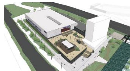
EUROSCOOP IN SCHIEDAM