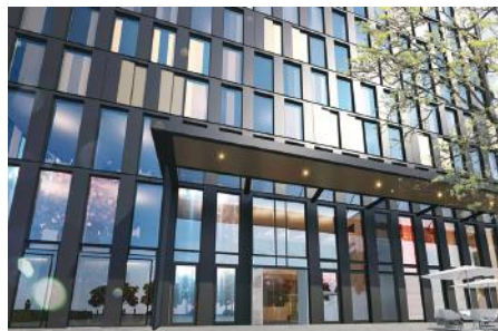
CROWNE PLAZA IN AMSTERDAM