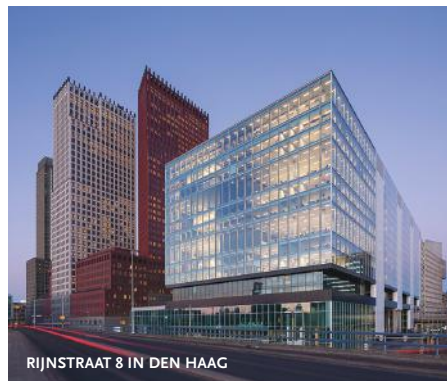
RIJNSTRAAT 8 IN DEN HAAG