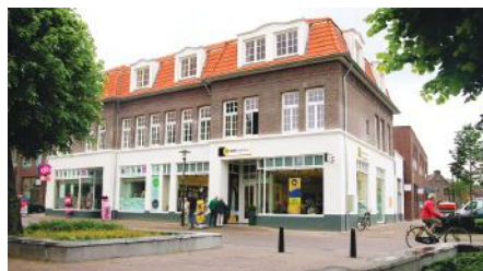
KERNPLAN IN VOERENDAAL

Met 20 medewerkers is AGS Architects een middelgroot bureau. In 2017 lag de focus vooral op winkelkernen, maar ook onderwijs, sportaccommodaties en kantoren behoren tot het werkterrein.