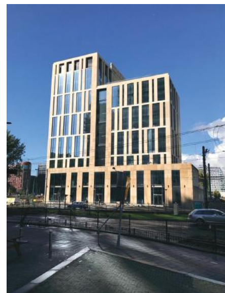
NOMA HOUSE IN AMSTERDAM

Het architectenbureau Dam & Partners komt dit jaar weer terug in de lijst door de oplevering van een kantoor aan de Zuidas. Op dit moment werkt het bureau samen met Jean Nouvel aan het nieuwe kantoor van het European Patent Office in Rijswijk. In de orderportefeuille zit ook het ontwerp voor de hoogste woontoren van Nederland, de Zalmhaventoren in Rotterdam.