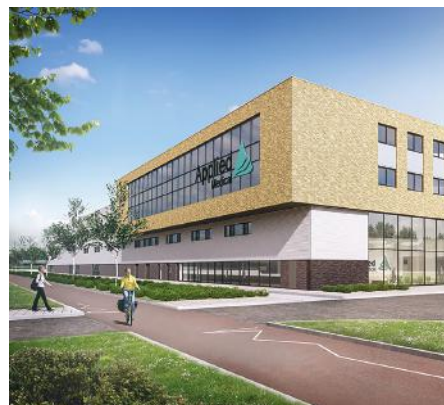
HUISVESTING APPLIED MEDICAL IN AMERSFOORT

Habeon Architecten is verbonden aan bouwbedrijf Heembouw. Zij realiseren veel bedrijfs-huisvesting, distributiecentra en kantoren. Ook dit jaar zijn ze te vinden in de top-10 van distributiecentra. De grote stijging ten opzichte van vorig jaar is te danken aan de realisatie van een aantal grotere kantoren.