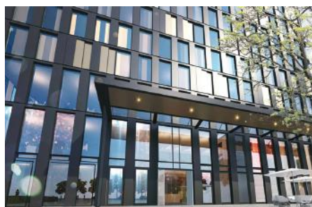
CROWNE PLAZA IN AMSTERDAM