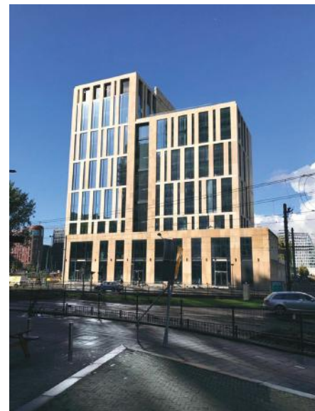
NOMA HOUSE IN AMSTERDAM

Het architectenbureau Dam & Partners komt dit jaar weer terug in de lijst door de oplevering van een kantoor aan de Zuidas. Op dit moment werkt het bureau samen met Jean Nouvel aan het nieuwe kantoor van het European Patent Office in Rijswijk. In de orderportefeuille zit ook het ontwerp voor de hoogste woontoren van Nederland, de Zalmhaventoren in Rotterdam.