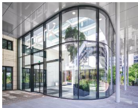
SPARK IN AMSTERDAM