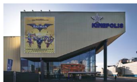
KINEPOLIS IN UTRECHT