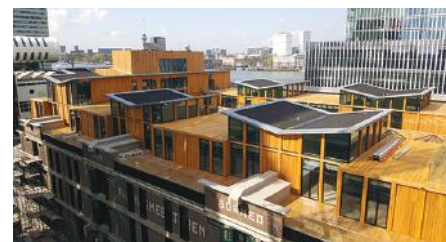
PAKHUIS MEESTEREN IN ROTTERDAM