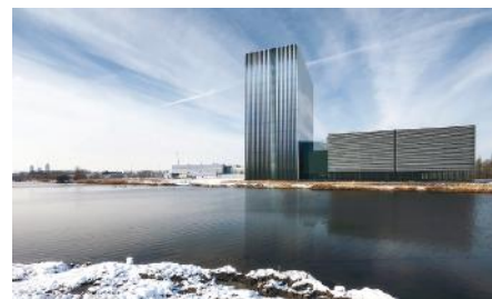
DATACENTER EQUINIX IN AMSTERDAM