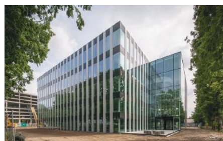
ONDERZOEKSGEBOUW VAN GENMAB IN UTRECHT

Met meer dan 60 medewerkers is Cepezed een architectenbureau dat succesvol zijn eigen niche gevonden heeft. Het bureau ontwerpt, bouwt en is ook ontwikkelaar. In 2017 leverde het onder andere twee gebouwen op voor de gemeente Westland en een onderzoeksggebouw voor Genmab.