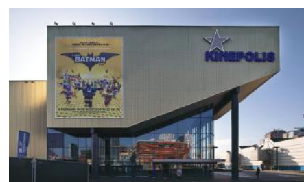
KINEPOLIS IN UTRECHT