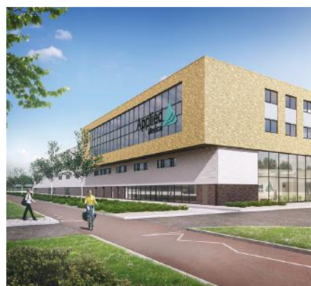
HUISVESTING APPLIED MEDICAL IN AMERSFOORT

Habeon Architecten is verbonden aan bouwbedrijf Heembouw. Zij realiseren veel bedrijfs-huisvesting, distributiecentra en kantoren. Ook dit jaar zijn ze te vinden in de top-10 van distributiecentra. De grote stijging ten opzichte van vorig jaar is te danken aan de realisatie van een aantal grotere kantoren.