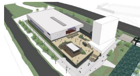
EUROSCOOP IN SCHIEDAM