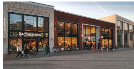
JACK AND JONES AAN HET VAN HEEKPLEIN IN ENSCHEDE