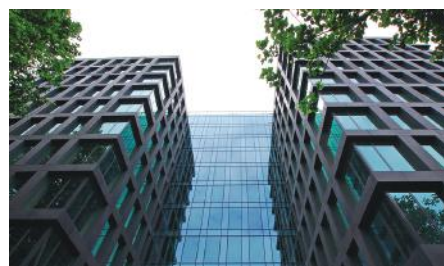
BLAAK16 IN ROTTERDAM

DZAP is een bureau dat meer biedt dan alleen ontwerp. Zij bieden opdrachtgevers architectuur, projectmanagement en facility management onder één dak. Het bedrijf richt zich op kantoorgebouwen, interieurs en het hogere woonsegment.