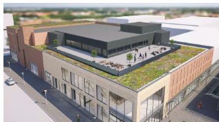
WINKELCENTRUM BOVEN 'T Y IN AMSTERDAM