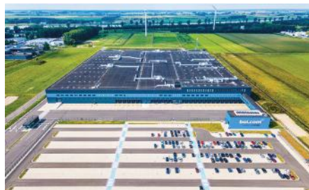
BOL.COM IN WAALWIJK