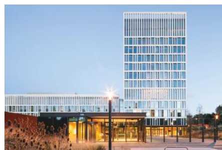
EUROJUST IN DEN HAAG

Oprichter Francine Houben stond dit jaar op een vierde plek in de NRC Cultuur Top-100, onder andere vanwege de vele prestigieuze opdrachten in het buitenland, zoals de renovatie van de New York Public Library en het enorme