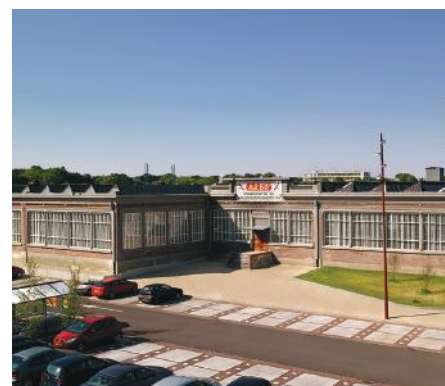
AABE FABRIEK IN TILBURG

Rijnboutt is ten opzichte van vorig jaar een plaats gezakt, maar nog steeds een van de grotere bureaus voor het ontwerpen van winkels en binnenstedelijke plannen. In 2017 heeft Rijnboutt twee grote retailprojecten opgeleverd, Hudson Bay in Amsterdam en de herbestemming van de AaBe Fabriek in Tilburg. Het bureau huurt vanaf dit jaar drie verdiepingen in een nieuw kantoor, dat is ontworpen door de nummer 3 op deze lijst, MVSA Architects.