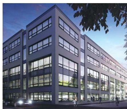
THE CLOUD IN AMSTERDAM

OPL Architecten leverde in 2017 – net als de bovenstaande vijf bureaus – een groot renovatieproject op. Kantoorgebouw The Cloud (in Amsterdam) voldoet nu aan hoge duurzaamheidseisen. En net als 'Het Atrium' werd ook dit project meteen bij oplevering verkocht. OPL werkt verder aan transformaties van kantoren naar woningen en binnenstedelijke plannen.