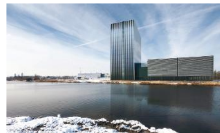
DATACENTER EQUINIX IN AMSTERDAM