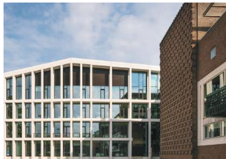
GELDERS PROVINCIEHUIS IN ARNHEM