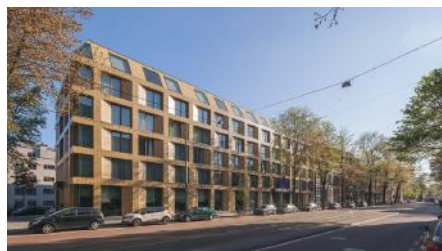
SPINOZA-HOTEL IN AMSTERDAM

Sinds de oprichting in 2012 heeft het bureau al