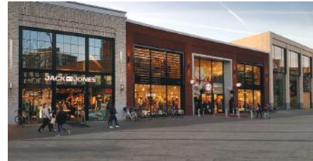
JACK AND JONES AAN HET VAN HEEKPLEIN IN ENSCHEDÉ