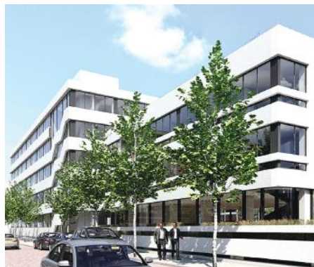
PETER VAN ANROOYSTRAAT 7, AMSTERDAM